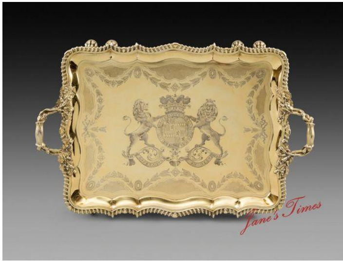
乔治四世鎏银托盘伦敦，1823年

近、当代美术作品方面，Gladwell & Patterson (伦敦)将呈献一系列欧洲及英国的印象派和现代绘画；杜梦堂(巴黎/上海/纽约)展出以野生动物为主题的杰出艺术品；思文阁(京都)将呈献现代及当代的日本艺术；Tanya Baxter Contemporary (伦敦)将展出战后的英国现代及当代艺术。