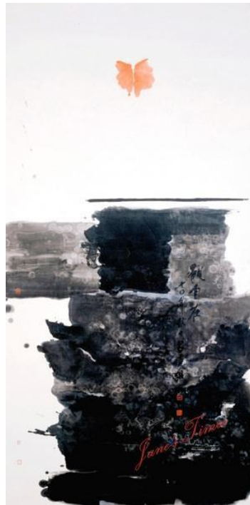
吕寿琨(1919 - 1975) 禅(5)1970彩墨纸本

令人惊喜的是，备受肯定的国际水墨艺术平台--“水墨艺博”本次与“典亚艺博”同期举行，参展画廊包括展出中国当代水墨画的汉雅轩(香港)、带来香港艺术家创新水墨作品的嘉图现代艺术(香港)，以及展出中国和日本艺术家作品的艾米李画廊(北京)。与此同时，水墨会(香港)将连续第四年成为水墨艺博2018的教育伙伴，并为水墨艺术家先驱吕寿琨(1919-1975)策划一特别展览。