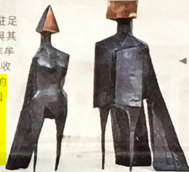
◀ Lynn Chadwick創作雙翼雕塑，Maquette V，1973年。由來自倫敦的Tanya Baxter Contemporary於典亞藝博2017售出。