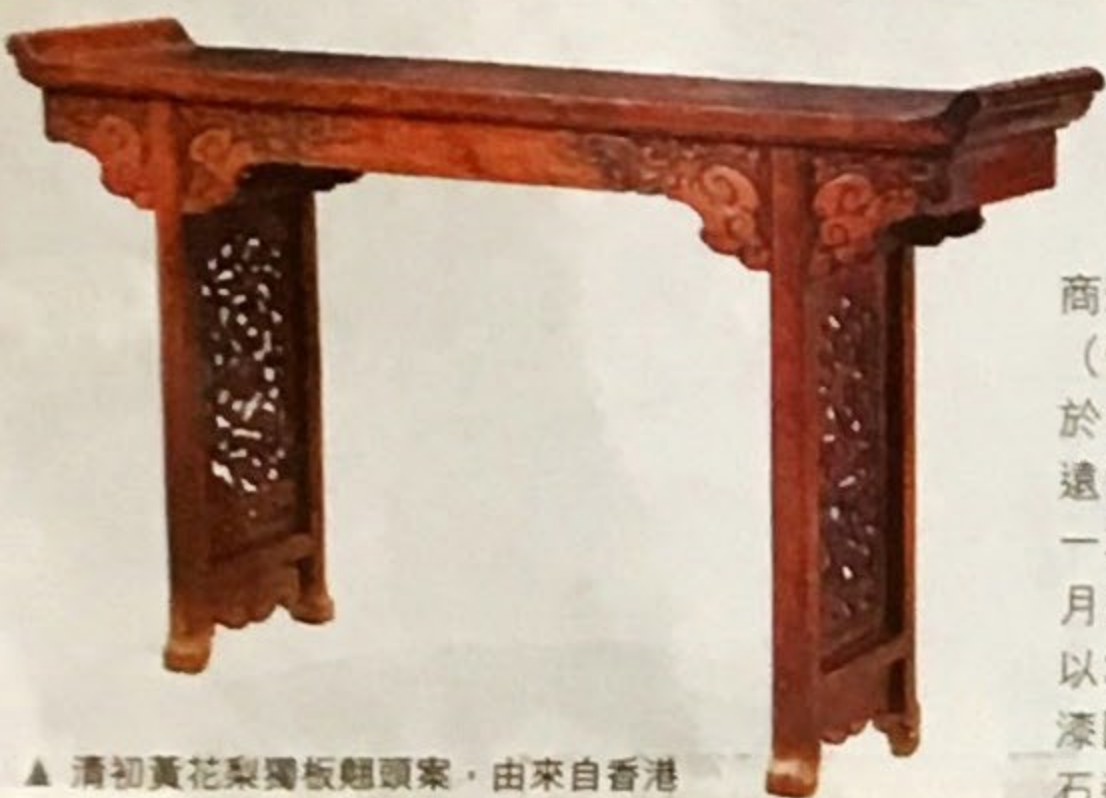
▲ 清初黃花梨獨板翻頭案，由來自香港的恆藝館於典亞藝博2017售出。