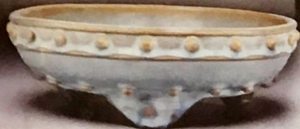
▲ 北宋時期 (960-1127) 的鈎窠月白釉鼓釘三足洗於典亞藝博2017由志遠堂古美術售出。