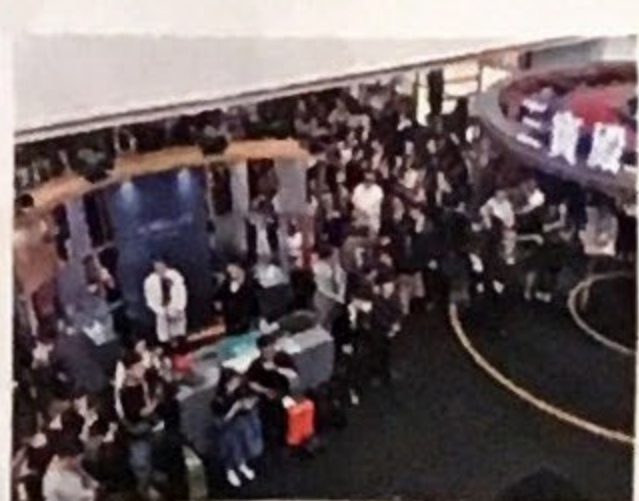
◀ 「三寶殿名表展」開幕典禮吸引高級製表行業中的精英蒞臨出席，場面喧嘩。