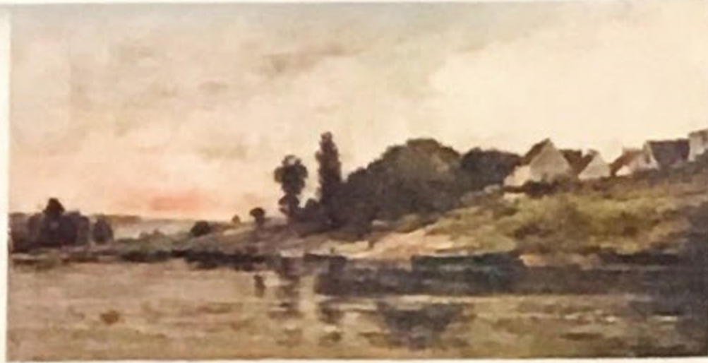
▲ 法國印象派畫家夏爾·弗朗索瓦·多比尼 (Charles-François Daubigny, 1817-1878) 的油畫作品《Bord de l'Oise, Le Soir》於典亞藝博2017由來自法國巴黎的Galerie l'Angelus售出。