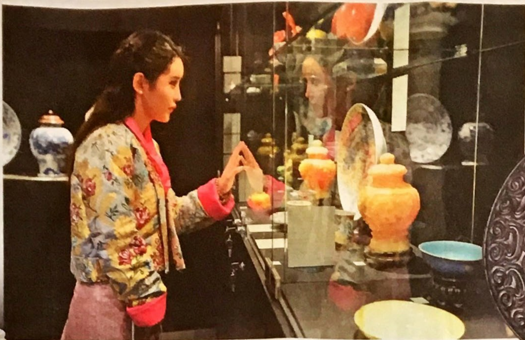
◀ 一位嘉賓正在預展中於來自荷蘭的Vandervelen東方藝術展位欣賞中國古董瓷器及玻璃藝術品。

被譽為亞洲最頂尖的國際藝術盛會——第十三屆典亞藝博 (Fine Art Asia 2017) 已圓滿結束。吸引世界各地眾多藝術品投資者、收藏家及鑑賞家出席，場面熱烈，總人次高達23,000人，藝術品銷情暢旺。