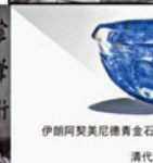
伊爾阿契美尼佛黃金石碗 (公元前5-4世紀)