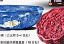
清代紅雕紋綉銀鍍金盒 (18世紀)