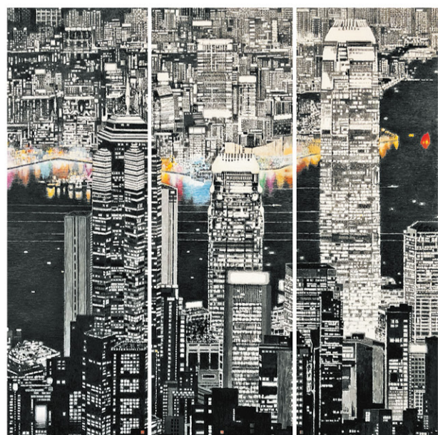
黃孝達 (1946年生) 維港紅帆 2018年 水墨設色紙本 高180 x 寬180公分 水墨創意會，香港

水墨藝博為多元媒體的水墨藝術提供了一個平台 — 不僅是傳統的紙本水墨作品，更涵蓋無數受水墨啟法、藝術形態嶄新的作品，以促進水墨藝術於國際間的相互理解。今年的畫廊代理展出的水墨藝術家來自中港兩地，當中包括大師級或年輕新進的藝術家作品，精彩紛呈。