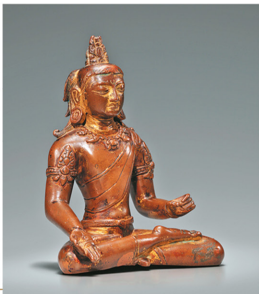
文殊菩薩 西藏、紐瓦爾藝術家，7-8世紀 鍍金銅、藍色礦物顏料 高19公分 Tenzing Asian Art, 三藩市

典亞藝博作為亞洲區內別樹一幟的博覽會，每年均就其已發展成熟的四個藝術專項 — 亞洲及西方古玩；藝術珠寶、古董銀器和鐘錶；印象派、現代及當代藝術和攝影，蒐羅世界各地的知名藝廊，將各具代表性的精美藝術呈現觀眾眼前，琳瑯滿目。觀眾可藉此難得的機會，一次過同場目睹逾八千件媲美博物館級珍品的展品，享受一場視覺盛宴。