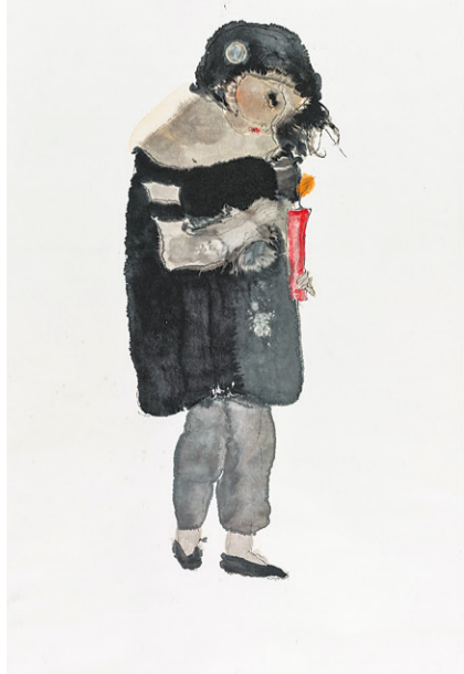
石虎 (1942年生) 幼神燃燭圖 1990年 紙本設色 高136.5 x 寬69公分 潔思園畫廊，香港/上海

潔思園畫廊致力於推廣近現代中國書畫及開拓內地和海外市場。石虎在中國畫壇叱吒風雲，是二十世紀後期中國繪畫史上的歷史人物。是次畫廊展出所藏石虎自八十年代後期到九十年代的作品，在其九十年代的作品中，可看出他一直投入在彩墨與重彩的追求之中。《幼神燃燭圖》線條自由奔放，墨彩自然交融，是他水墨作品中的代表之作。