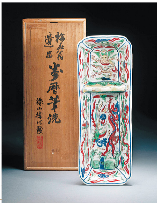
明 萬曆 五彩龍鳳戲珠紋筆擱 《大明萬曆年製》 雙方框六字楷書款 長 29公分 來源：萬野美術館， 藏品編號347 香港佳士得2002年10月28日， 拍品537號 明成館，香港

在古玩方面，來自美國的 Tenzing Asian Art 是典亞藝博的固定展商，每年為藝博會帶來一系列喜馬拉雅佛教藝術傑作。創辦人 Iwona Tenzing 於2006年成立其藝廊，網羅源自印度、西藏、尼泊爾、柬埔寨及泰國等地的藝術品，並於南亞組織展覽、收購及銷售雕塑、畫作及裝飾藝術品擁有多年經驗。