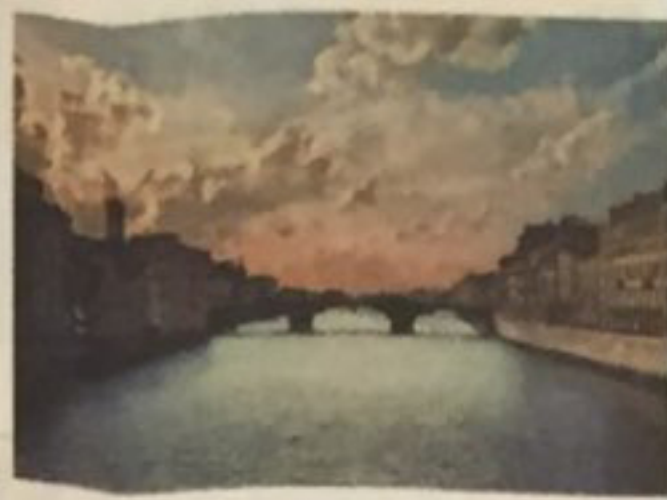
Albarran Cabrera (1969年生) 《This is you here #106》 沖印: 2017年 礦物顏料、麻皮紙、金箔 版次: 5/20 (版數20+2藝術家特別版) 高17×寬25公分