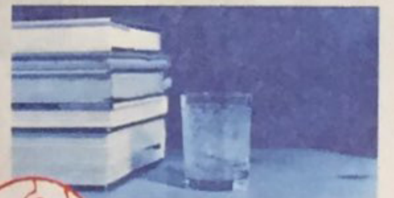
馬召其 (1976年生) 《懷允不忘 - 確實讓人念念不忘》 2018年 水晶杯 高6×直徑4.2公分