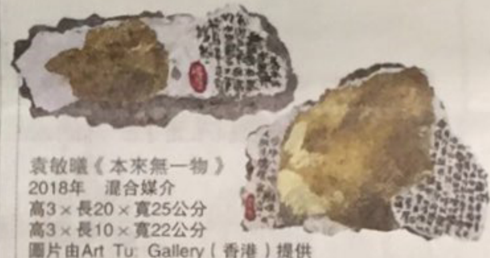
袁敬曦《本來無一物》 2018年 混合媒介 高3×長20×寬25公分 高3×長10×寬22公分