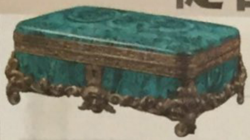
精美俄羅斯ormolu鑲嵌孔雀石首飾盒 (配原裝鑰匙) 約19世紀早期 高10×長24×深18公分