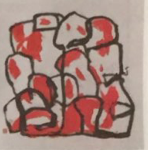
康雁屏 (1958年生) 《山 - 偶遇 (8)》 2018年 水墨設色紙本 高138×寬68公分