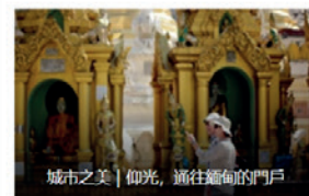
城市之美 | 仰光，通往緬甸的門戶