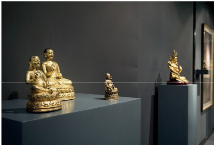
Rossi & Rossi 帶來佛教藝術作品。