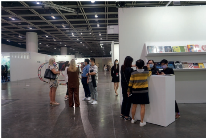
典亞藝博與巴塞爾藝術展聯手，帶來「藝薈香港」展會，可以說是「世紀合作」。