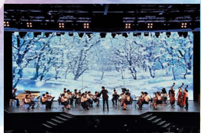
▲「香港希望之聲周年音樂會」近日舉行