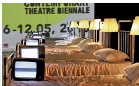
▲開幕儀式搬到舞台，和開幕大戲場景融為一體