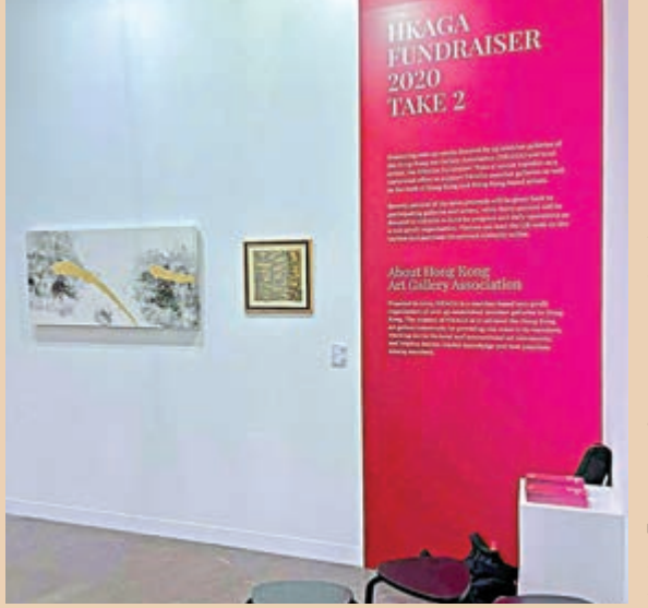
▶香港畫廊協會籌款展覽「Take 2」現場