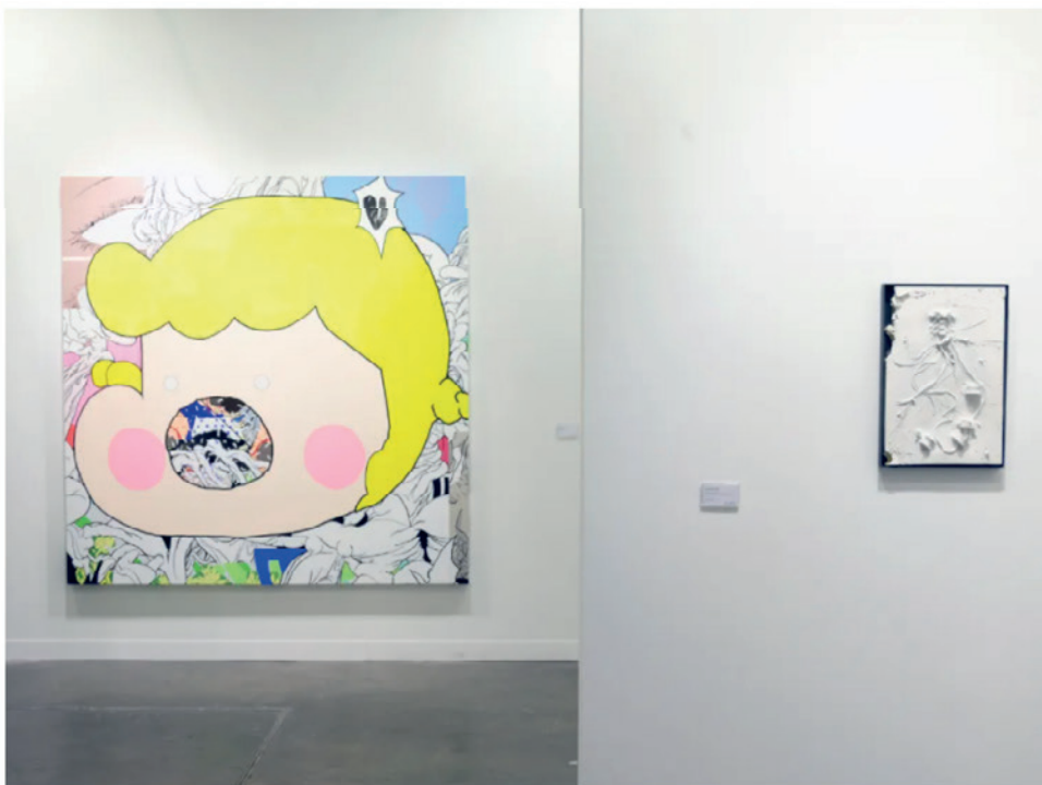
2020艺荟香港德萨画廊展位，左为钟慰2020年作品《玩偶》(Doll)，右为陆浩明2020年作品《退后，向前 No. 5》(Past Forward No. 5)

钟慰则通过收集网络模因和图像组成数据库，利用电脑建模电子草图后将构图转移至画布上，以此描绘凌乱但有生机，同时受到高度监视的互联网视觉文化。据德萨画廊总监Willem Molesworth 向《艺术新闻 / 中文版》表示，此次展会上画廊的销售情况可观，亦接触了许多新藏家。