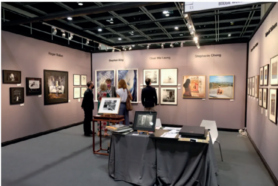
上图：2020艺荟香港Over the Influence展位；下图：2020艺荟香港Boogie Woogie Photography展位