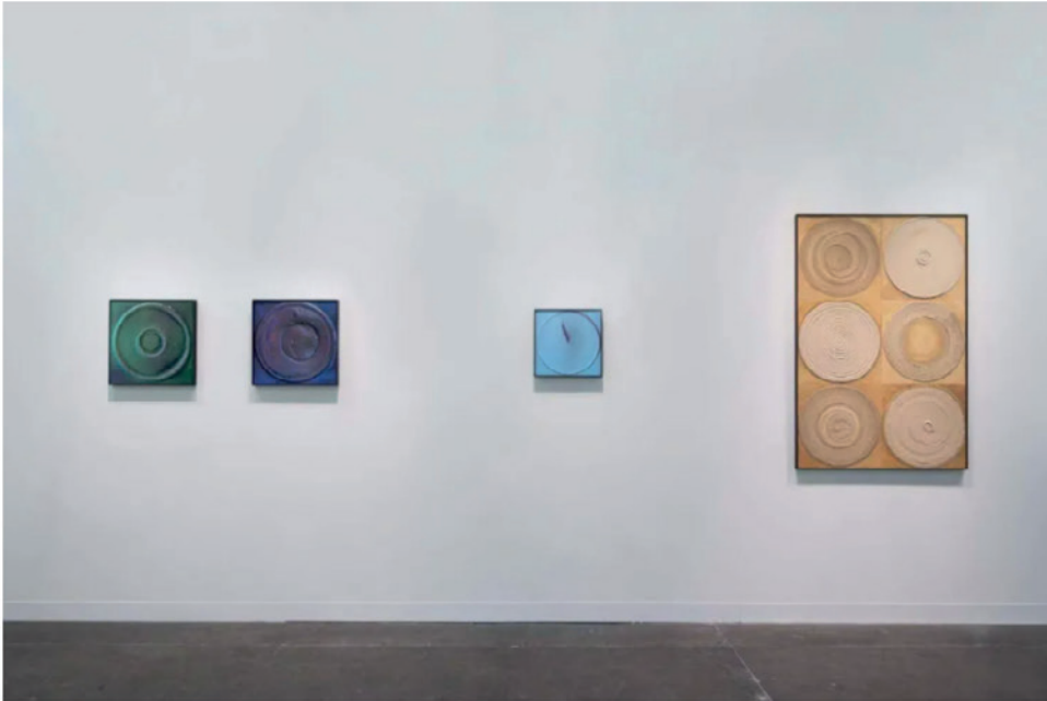
2020艺荟香港维伍德画廊展位，图片来源：维伍德画廊