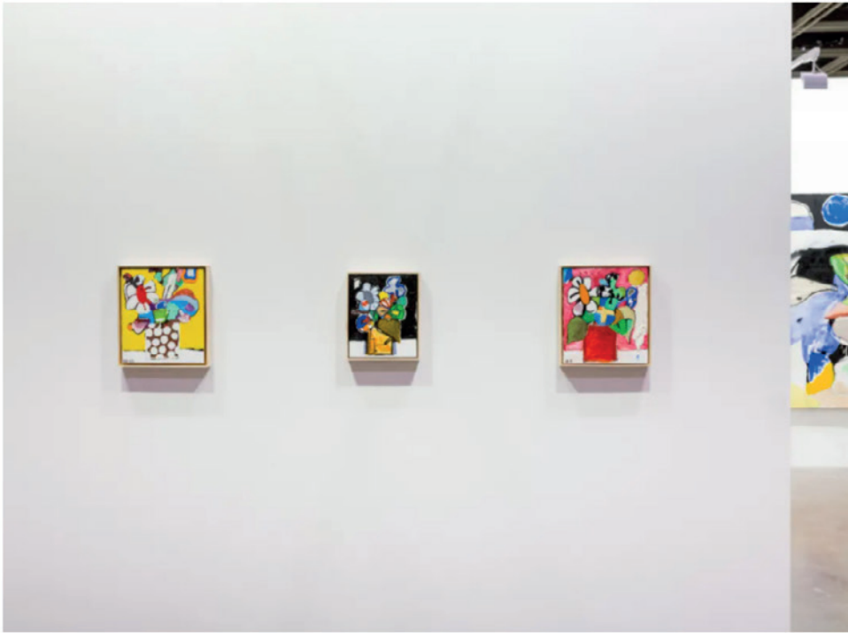
2020艺荟香港贝浩登展位，图片来源：贝浩登

自1963年加入日本具体艺术协会，并成为具体派成员中少数女性艺术家之一的名坂有子的个展在维伍德画廊（Axel Vervoordt Gallery）呈现，这家秉承“虚无”（Void）概念的画廊在2020年首次加入巴塞尔艺术展香港展会。来自艺术家60年代至80年代，以及2015年至2017年的作品共同亮相，自60年代开始活跃于日本艺术界，名坂有子用工业技术、模组化结构和未来派色彩打破了当时男性主导文化中对女性创作的刻板印象，同时为女性的社会地位正言。她在40年前所实践的议题，与今天的社会仍有呼应。展会期间，画廊共售出超过半数作品，其中多数在首日便已售出，价格在1.8万至4.5万欧元之间。