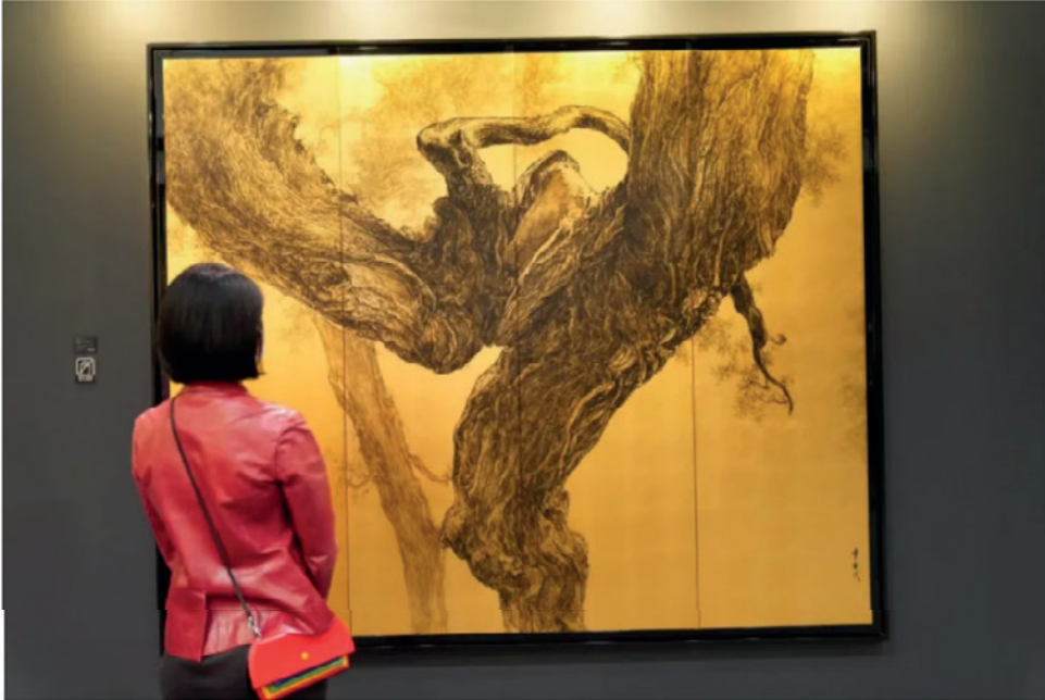
典亚艺博2020季丰轩展位呈现的李华式作品，图片来源：典亚艺博