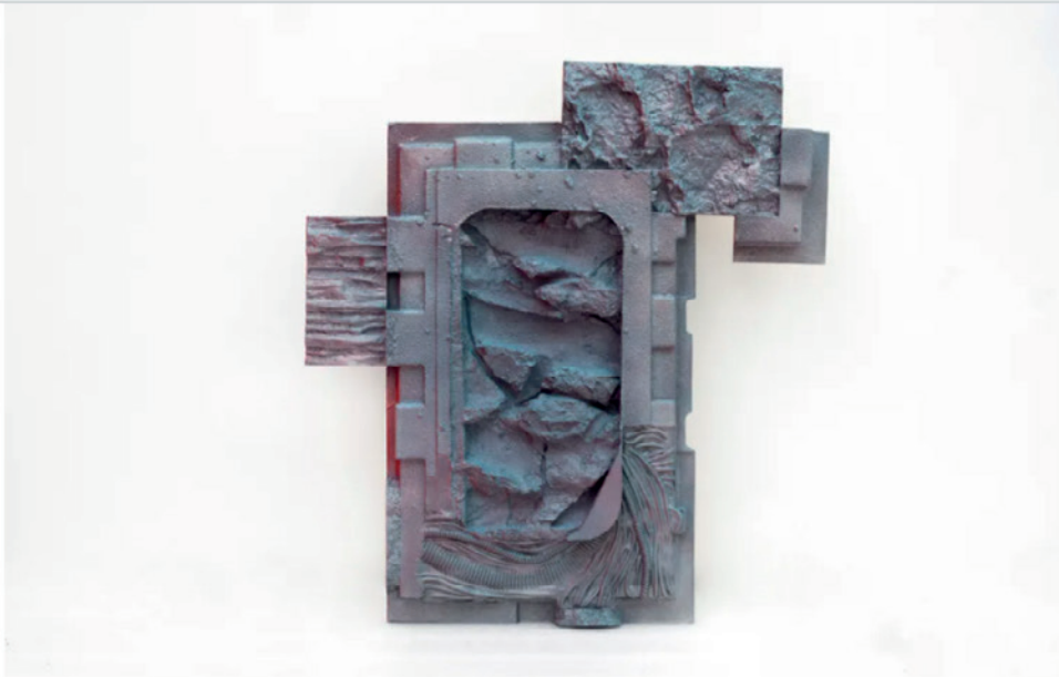
陆浩明，《深层地球资源 No. 2》(Deep Earth Resources No. 2)，2020年，图片来源：德萨画廊及艺术家