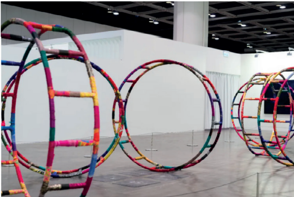
维伍德画廊呈现的金守子 (Kimsooja) 大型装置作品《无题》

除了主展位之外，由维伍德画廊所呈现的金守子 (Kimsooja) 大型装置作品《无题》也在展会的项目空间展出，该作品来自艺术家的“演绎物体”系列，也是标志着艺术家开始运用织物覆盖物体，并发展至三维空间的实践的系列，《无题》是由7个被旧衣物和线覆盖的金属环组成的装置。在今年3月份的巴塞尔艺术展线上展厅，维伍德画廊就曾呈现金守子个展。