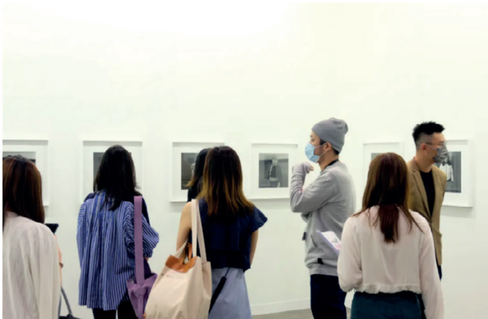
2020艺谷香港现场