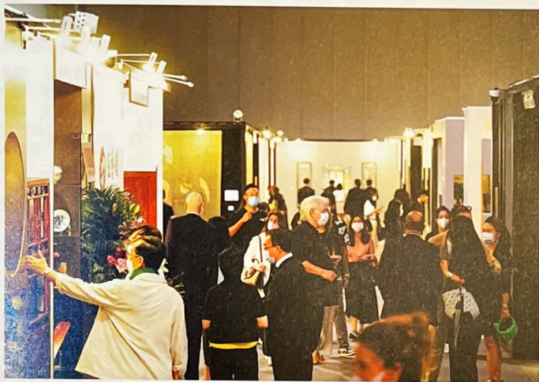
典亞藝博2021參觀人數絡繹不絕

品，貴賓預展當天即售八幅。Tanya Baxter Contemporary (倫敦/香港) 售出數件作品，包括臺灣藝術大師朱銘太極系列中的青銅雕塑及 Damien Hirst 之限量版畫作品「Honesty」。Contemporary by Angela Li (香港) 於貴賓預展售出藝術家阮家儀和黃詩慧、江玉儀作品。