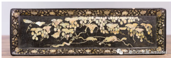
栗色漆镶嵌铜松鼠葡萄纹承 (元代，十四世纪)

Andy: 我从小开始接触古董家具，这些家具一直在我家里。我们以前到外地参加艺博会，从而启发创办典亚艺博的念头，香港作为亚洲金融中心，所有配套都非常完备及充分，唯独欠缺国际性的艺博会，所以在2005年我们便创办了首届典亚艺博。