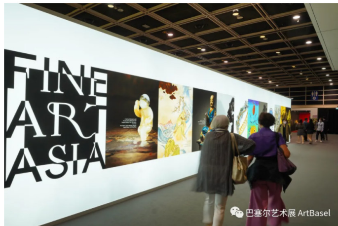
往年典亚艺博现场图

Original | 巴塞尔艺术展 巴塞尔艺术展 ArtBasel | 10/7