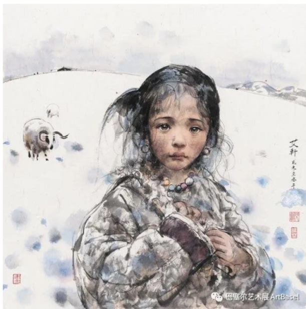
《冻原》(2013)，文轩

Susanna: 我比较喜欢一些能放在家中作为装饰的艺术品，主要是当代艺术画，尤其是香港年轻的艺术家作品。