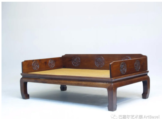
黄花梨二屏团龙式罗汉床（明代，十六世纪）

因为我的专项是家具收藏，所以实用性相对较强；我们的家里就是很好的例子，我们会把古旧的家具与当代的沙发一同放置——连我们的办公室也正使用部分古代的桌子和木柜，而且我也十分欢迎到访者坐在我艺廊展示的椅子上。