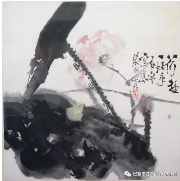
《荷趣—蛙声》（1975），石鲁