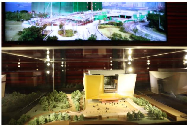
香港故宮文化博物館展區以3D模型展示香港故宮面貌。

展覽期間，香港故宮將主辦多場講座，由研究員、策展人等分享籌備博物館的幕後故事，另有專員駐場，示範及介紹上千年歷史的中國書畫修復技藝。