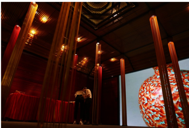
香港故宮文化博物館亦有參展，展區參照葉某城太和殿設計。