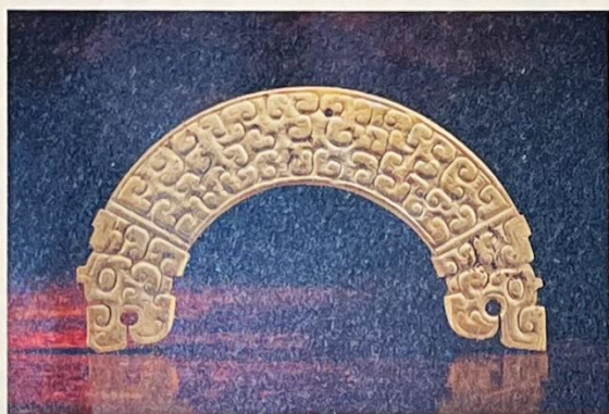
春秋 玉璜 Rasti Chinese Art (香港)