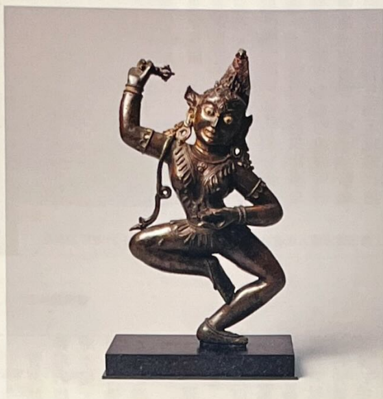
約12世紀 空行母 Rossi & Rossi (倫敦/香港)

鑑於大會海外展商及眾多藏家今年仍然未能來港，典亞藝博二〇二一很高興能協助國際展商遙距參與博覽會。同時，大會線上活動將與我們全球的收藏觀眾及藝術愛好者保持聯絡。典亞藝博此次亦欣然與香港畫廊協會合作，歡迎領先的香港畫廊參與大會。與去年獲得巨大成功的「藝薈香港——由巴塞爾藝術