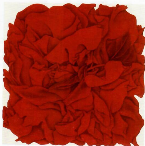
康春慧 須彌之三 設色紙本 60×60cm 2019 伍拾伍號院子藝術空間 (北京)