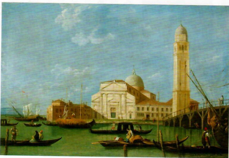
卡納萊托 威尼斯聖伯多祿聖殿 布面油畫 86×125cm ART PERSPECTIVE Limited (香港)

典亞藝博二〇二三特別策劃展覽「遊園觀藝」，是對古董收藏的一種年輕而有活力的詮釋，以花園主題和人工智慧來呈現各項古董與藝術作品。花園，往往是我們初次接觸大自然的地方。它作為大自然的縮影，在細小的空間呈現了其變化萬千且宏偉壯麗的景觀，讓我們能感受到大自然的美。藉花園之意、以花園之名，典亞藝博二〇二三為有意開展藝術收藏旅程的觀眾特別策劃了全新展區「遊園觀藝」，讓他們可以踏出藝術收藏的第一步。此展區猶如一座包羅萬象的花園，呈獻琳琅滿目的藝術品——不論觀眾是想體驗藝術品的精湛工藝、觸摸古董背後的歷史痕跡，還是僅僅近距離觀賞藝術品，我們相信這裡能夠實現所想、尋獲至寶。我們歡迎您來臨「遊園觀藝」，並希望這個展區能點燃您心中對藝術收藏的熱情。