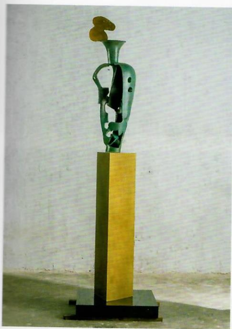
李光裕 天瓶 銅 33×32×199cm 2022 采泥藝術（臺北）

典亞藝博於二〇〇六年由香港藝術專家成立，是國際藝壇公認、於亞洲區內舉足輕重的年度國際古董及藝術