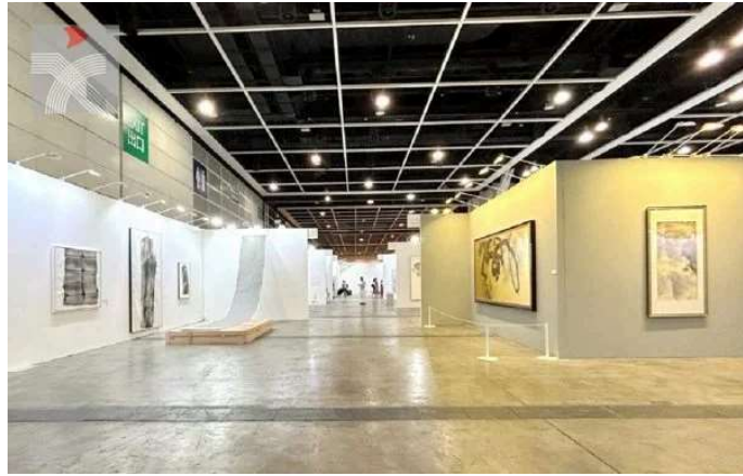
展覽現場一角。右邊為1991年成立的香港季豐軒畫廊展位。(香港文聯網)

與「水墨藝博」同場啟動的還有主辦機構國際藝展有限公司策劃的「典亞藝博」(Fine Art Asia)。這個創立於2006年的國際古董及藝術博覽會，同樣由海外與本地藝廊畫廊及機構展銷，展示不同年代、地區和類型的收藏品，包括古玩、古典傢俱、珠寶、現代及當代藝術，帶領觀眾穿越中西古今。兩個藝博會均展至周日(8日)。