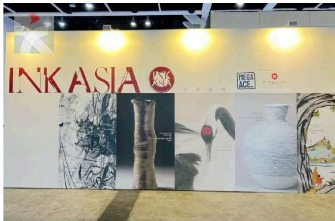
展覽入口處。

本屆藝博一大特色是，主辦方嘗試從多角度探討中國水墨的突破與傳承，除了知名畫廊帶來大師級藝術家傑作外，也採用了互動式展覽及元宇宙沉浸式展覽展示非傳統的水墨作品，充分體現科技發展與藝術創作的密切關係，反映中國傳統藝術的無限可能性，亦助大眾以嶄新形式接觸中華文化的元素，共同推進中華文化的傳承和創新發展。