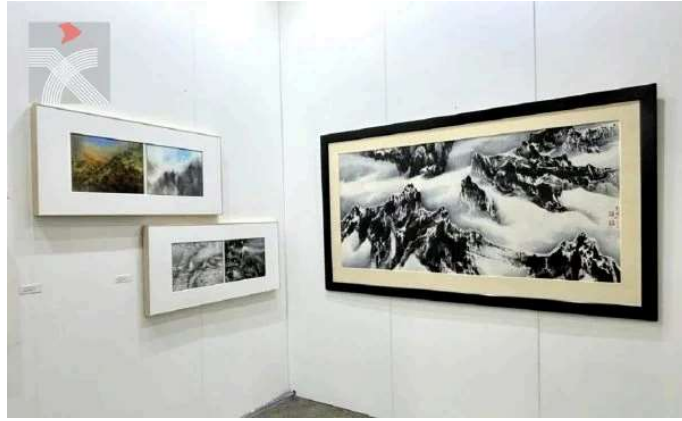
由香港漢雅軒畫廊呈現的台灣現代水墨大師劉國松作品，右為《宇宙即我心之十九》。