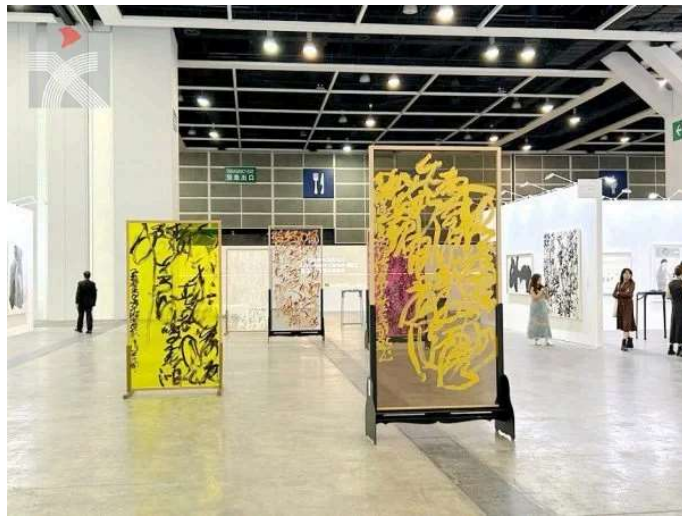
上海書畫大師王冬齡多幅《亂書彩屏》放置展場中央。

此外，現場還設有「公眾藝術展示」，放置六位名家的藝術裝置，包括位於展場中央、由香港漢雅軒畫廊代理的書畫大師王冬齡多幅《亂書彩屏》和徐龍森的巨型屏風《萬山朝宗》；其他有台北「采泥藝術」旗下雕塑家李光裕的組合裝置《墨幻秘境》、北京「太和藝術空間」代理的廖建華作品《無意圖》，以及香港藝倡畫廊雕塑家李展輝的《山水裝置》和水墨大師靳埭强的四屏《意在山林》，後者以數碼錄影呈現。