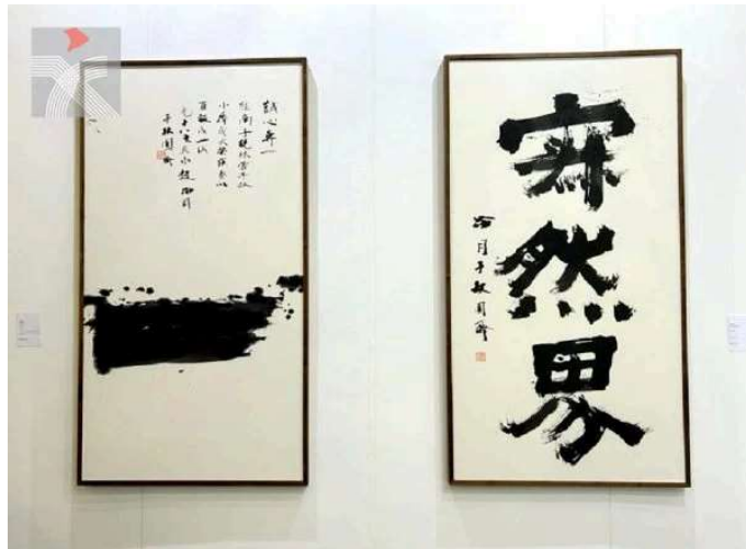
老一輩先鋒書法家趙冷月的榜書《一》(1992)和《寂然界》。

另一個值得留意的名家展位是，由北京雲杪藝術中心介紹的中國老一輩先鋒書法家趙冷月創作於上世紀九十年代的多幅榜書作品，包括《一》(1992)、《思無邪》(1992)、《佛緣》、《謙》、《寂然界》等。