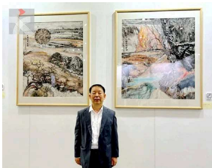
上海著名藝術家姜炳清和他的兩幅保護地球題材近作：《天坤之象八面風》(左)和《冰與火交融後的靜謐》。(香港文聯網)

香港Artasus Fine Art則首次向香港及海外介紹上海著名藝術家姜炳清，在現場展示逾30幅不同題材和風格的作品，包括鄉村生活、人物和環保，既有傳統寫實，也有具象抽象。早年師從吳冠中，張一民大師的姜炳清畢業於山東工藝美術學院壁畫系，乃國家高級工藝美術師，在中國公共環境藝術領域享負盛譽。其於上世紀八十年代創作的油畫《做泥翁》、《秋日的正午》就獲國家文化部選送至加拿大、奧地利、墨西哥、巴拿馬國際貿易博覽會展出；2016年創作的中國最大珙瑯鉑金壁畫《春華》落戶上海世博會園區，這次也在同場的「典亞藝博」展區展示《春華》小型版(局部)及部分工藝美術作品。