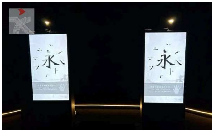
以「永字八法」為主的互動裝置助觀眾了解書法基本技巧。

在另一個「特別展覽」之水墨+項目「影戲」環節，大會邀請9位藝術家展出另類「水墨」作品。巧妙地挪用水墨元素和意念，運用非傳統水墨媒介創作令人耳目一新但又蘊含人文神髓的當代藝術，包括錄像、新媒體、互動裝置、沉浸式投影及結合人工智能的創作等。該項目旨在鼓勵藝術家改革創新，探討水墨藝術的伸延性，並展現各種遊走於水墨邊緣的實驗。