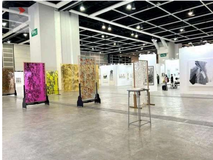
本屆「水墨藝博」(Ink Asia)展場空間寬闊。

由於疫情而闊別三年的「水墨藝博」(Ink Asia)金秋回歸，來自大中華地區約27間畫廊和藝術機構偕旗下藝術家於周四(5日)起在香港會議展覽中心公開呈獻源自中華傳統文化的水墨佳作，傳統技法、創新科技共治一爐，為觀眾們帶來一場兼具動態流彩的視覺盛宴。