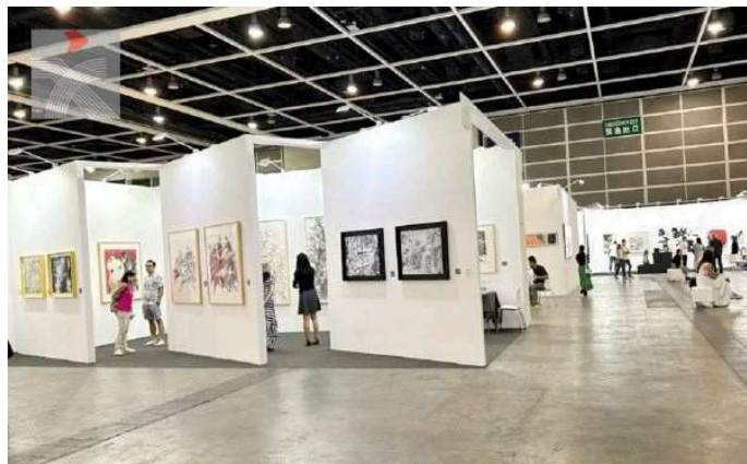
展覽現場一角。左邊為去年成立的澳門「蓮花藝術」畫廊展位。