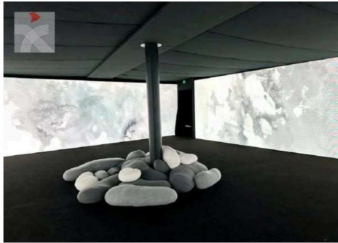
在這裡，參觀者可身臨其境般體驗水墨世界的奇妙。(香港文聯網)