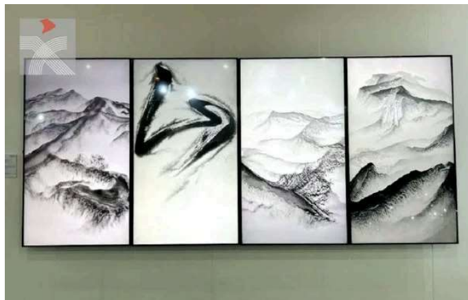
香港水墨大師靳埭强的四屏《意在山林》以數碼錄影呈現。(香港文聯網)

這些作品或立體或流動的，但其靈感和呈現的內容都源於傳統水墨畫，充分反映當代水墨的創新發展。此外，台北雕塑家李光裕以「鏤空」等標誌性技法打開雕塑的封閉結構，形成獨特的「空」的形式、風格與觀念，呈現出一種物我兩忘的「東方空境」，不僅具有美學價值，亦蘊含對當下生命狀態的思考，具有當代的社會意義。